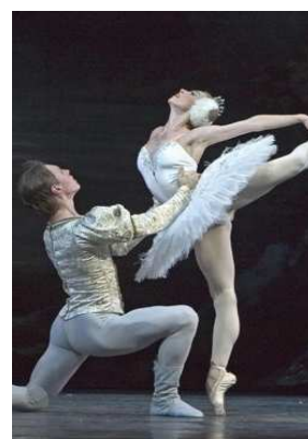
« Le lac des Cygnes »