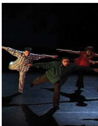
« Nobody »