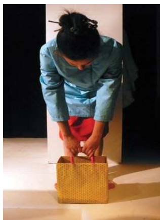
« Ou va l'eau ? »

Nous avons parcouru le catalogue puis nous avons fait plusieurs suggestions :