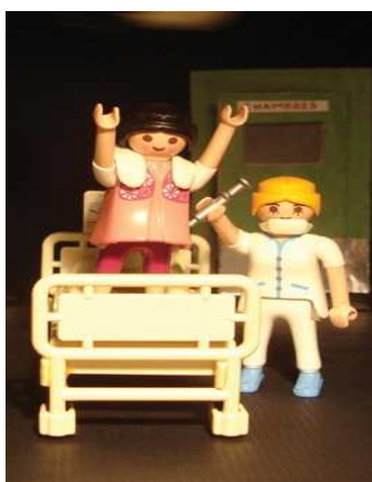
« Klaxon, trompettes... et pétarades »