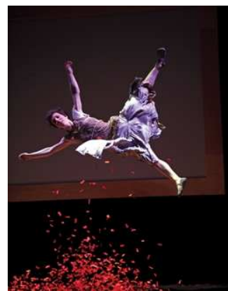
« L'atelier du peintre »