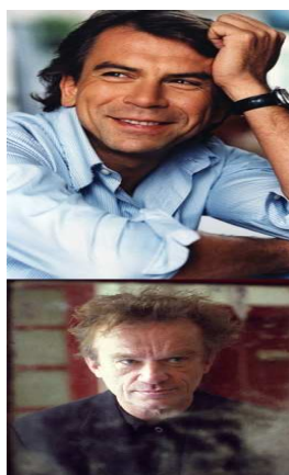
« Un pied dans le crime »