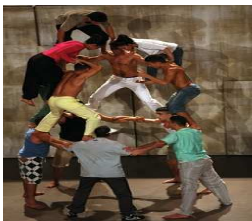
« Chouf Ouchouf »

Nous avons fait un vote et nous avons choisi :